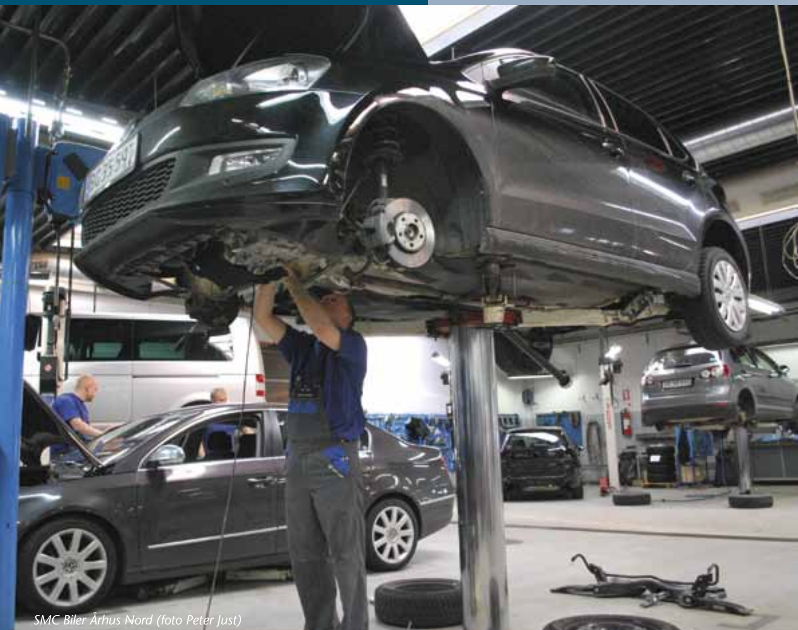
SMC Biler Århus Nord